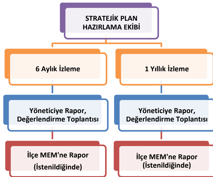
Şekil 2 İzleme ve Değerlendirme Süreci

Kurumumuzun 2019-2023 Stratejik Planı İzleme ve Değerlendirme sürecini ifade eden İzleme ve Değerlendirme Modeli hazırlanmıştır. Okulumuzun Stratejik Plan İzleme-Değerlendirme çalışmaları eğitim-öğretim yılı çalışma takvimi de dikkate alınarak 6 aylık ve 1 yıllık sürelerde gerçekleştirilecektir. 6 aylık sürelerde Okul Müdürüne rapor hazırlanacak ve değerlendirme toplantısı düzenlenecektir. İzleme-değerlendirme raporu, istenildiğinde İlçe Milli Eğitim Müdürlüğüne gönderilecektir.